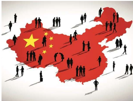
Guanxi: la clave del éxito?