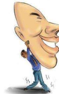
Mianzi: convivencia de largo plazo